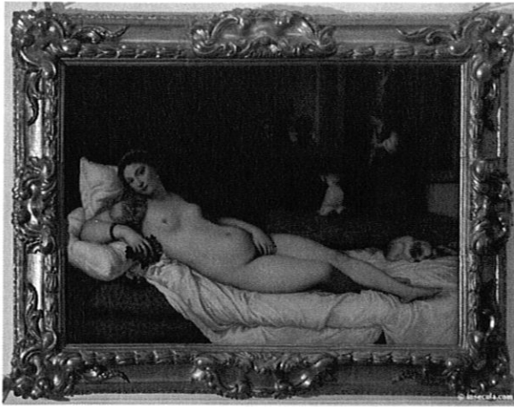
Tiziano Vecellio(Titian, 1490-1576), 《烏畢娜的維納斯(Venus of Urbino)》, 1538 - 1539, 119 x 165 cm