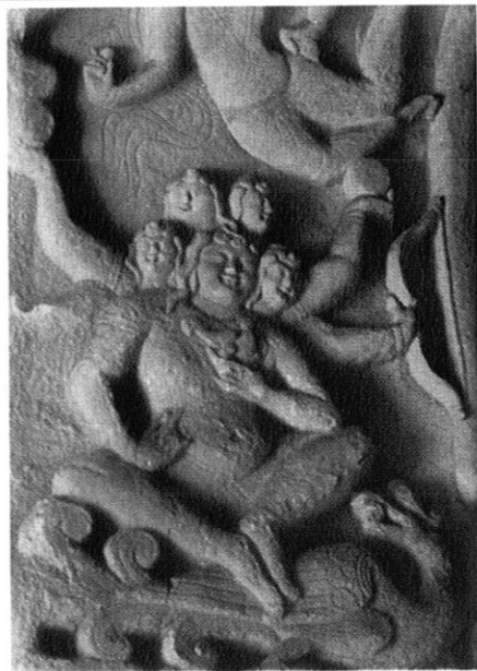
圖二、大同雲岡石窟佛像，北魏朝，460-494年