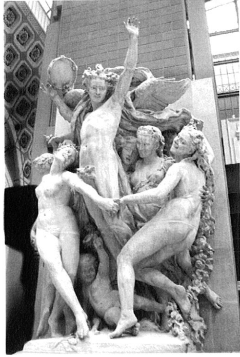
圖一·瓊·巴蒂斯特·卡波(Jean-Baptiste Carpeaux)，《舞蹈》，