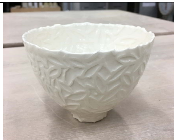
白瓷碗表面有淺浮雕質感