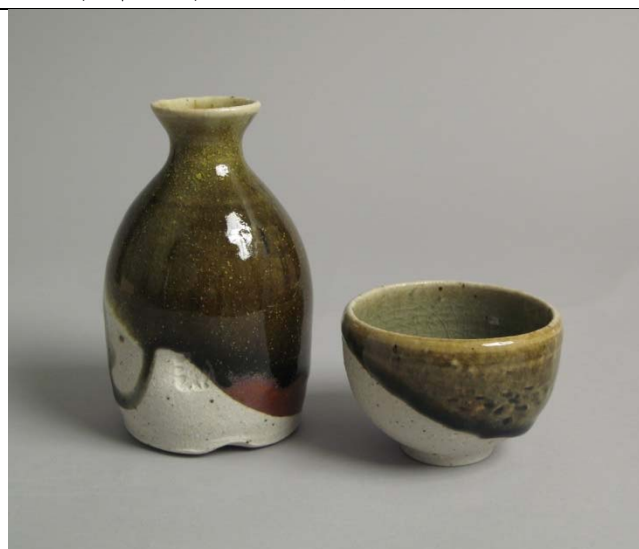
陶器：清酒瓶、清酒杯