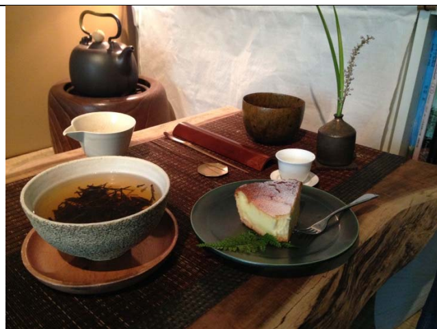
茶席、茶具組、手工陶碗、點心